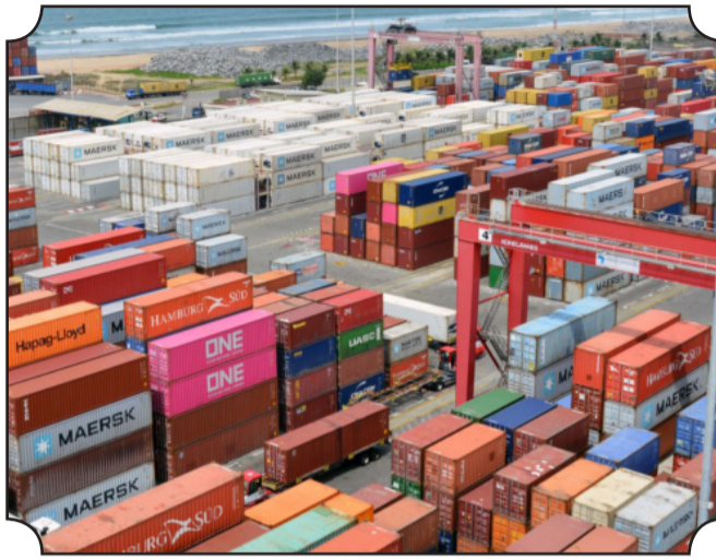
● Terminal portuaire du Port de Cotonou

Selon le rapport, les taux de croissance du commerce au premier trimestre 2022 sont restés élevés dans toutes les régions géographiques, bien qu'un peu plus faibles dans les régions de l'Asie de l'Est et du Pacifique. La croissance des exportations a été généralement plus forte dans les régions exportatrices de produits de base, car les prix des produits de