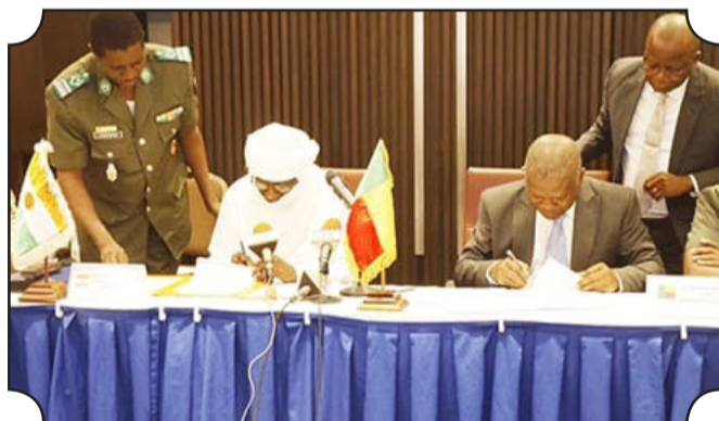
● signature de documents

le président Mohamed Bazoum et a justifié : « Quand nous avons regardé tout autour de nous, le pays qui a une meilleure résilience, c'est le Niger ». Ainsi, le Bénin entend apprendre du Niger dans le souci de mieux réagir au phénomène terroriste auquel le pays est de plus en plus confronté. Selon le ministre de la défense nationale du Niger, Alkassoum Indattou, cet accord vient formaliser le cadre de coopération militaire entre le Niger et le Bénin. Il a salué l'intérêt qu'accorde ce pays à la coopération militaire avec le Niger. « Malgré les difficultés, le Niger est devenu un modèle, une source d'inspiration pour les autres pays confrontés à ce phénomène. Si aujourd'hui le Bénin a besoin de l'appui dans ce domaine, le Niger est disposé à aider ce pays frère. Le Niger est prêt à accompagner les autres pays pour renforcer leur résilience », a rassuré le ministre de la défense du Niger.