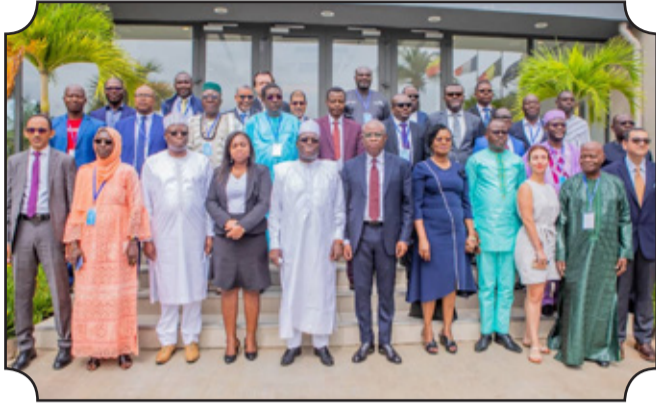
• Photo de famille des participants au lancement

Développé en partenariat avec les populations d'Afrique de l'Ouest qui vivent sur les zones côtières et en dépendent pour leurs moyens de subsistance, leur sécurité alimentaire et leur prospérité, le Programme WACA ResIP a trois ans de mise en œuvre sur une durée totale de 5 ans. Tenant à l'atteinte effective des objectifs définis pour ce projet, lesquels objectifs sont, entre autres : améliorer la gestion des ressources côtières communes et réduire les risques naturels et anthropiques auxquels sont exposés les communautés côtières, le Comité régional de pilotage dudit projet s'est réuni à Cotonou, vendredi 15 juillet 2022. Présidant la rencontre, le ministre du cadre de vie et du développement durable du Bénin, José Tonato a remercié les parties prenantes pour la compétence et la contribution qualitative dont elles ont fait preuve pour donner vie à ce projet.