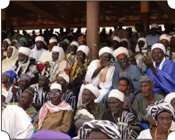
● Quelques invités

Notons que cette forte délégation dépêchée par le président Patrice Talon a rehaussé l'éclat des manifestations. Elle a transmis