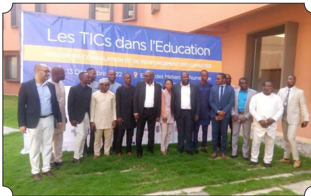
• Photo de famille

Cet atelier de deux jours, vise la dissémination du plan directeur de développement des compétences et le renforcement des capacités des TICs dans l'éducation au Bénin. Cette activité intervient dans un contexte où la numérisation de l'éducation révèle un potentiel considérable pour améliorer l'apprentissage et nécessite une approche plus globale et contextualisée de l'innovation. Le plan directeur de développement des compétences et de renforcement des capacités des TICs dans l'éducation résulte d'une recherche quantitative et qualitative combinée qui analyse le paysage et les défis des TICs dans l'éducation spécifiques au continent africain. La mise en œuvre de ce projet prend en compte la diversité des contextes et reste dans l'optique de fournir différents points de départ aux pays. L'étude a créé cinq scénarios différents (clusters), chacun avec un aperçu à