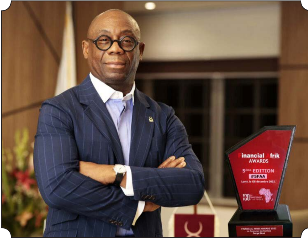
• Le Président de la Banque Ouest Africaine de Développement (BAOD), Serge Ekue

dans la gestion du président Serge Ekue. Mieux, cette édition des Financial Afrik Awards s'est déroulée autour de la Finance Verte, et la Banque Ouest Africaine de Développement, partenaire institutionnel a fourni également d'importants efforts dans ce sens. Pour cette édition des FAA, la BOAD à l'instar d'autres institutions a pris part à cette manifestation, s'érigeant en leader de cette dynamique, qui porte nombre de problématiques et d'impératifs, tels que ceux ayant trait aux financements des projets s'inscrivant dans les réponses à apporter aux effets néfastes du changement climatique,