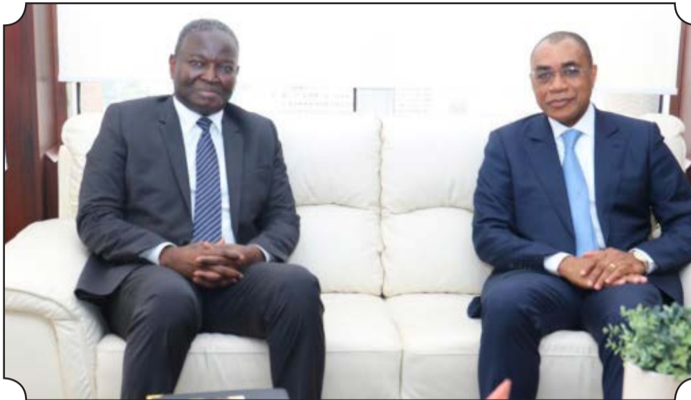
• Le Pdt Abdoulaye Diop (à gauche) et le Pdt Adama Coulibaly (à droite)

Prendre contact et discuter des défis de l'Union tant sur le plan social qu'économique. Tel est le mobile de l'audience qui s'est déroulée au cabinet du ministre de l'économie et des finances de la Côte-d'Ivoire, Président du Conseil des ministres de l'Union économique et monétaire ouest-africaine (Uemoa). Orientée sur les questions relatives à la marche de l'Union, cette rencontre a été l'occasion pour le Président de la Commission